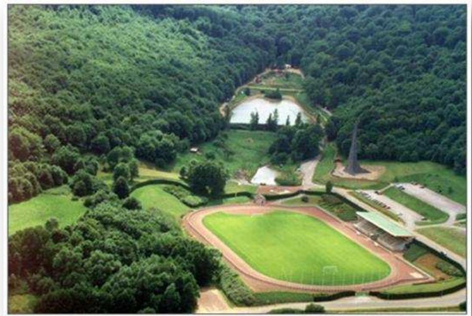
Site du Fond St-Martin à Rombas.

Évènement phare du weekend, le Championnat de France des Clubs se déroule sous la forme d'un relais. Les équipes des différents clubs sont réparties en 4 divisions pour se disputer le titre national (un titre par catégorie). Le classement final permettra l'accession en division supérieure des meilleures équipes et la relégation en division inférieure des moins bonnes. Cette compétition est singulière en course d'orientation puisqu'il s'agit pour chaque athlète de donner le meilleur de soi même pour son équipe. Il en résulte une dimension collective, rendant la course particulièrement populaire au sein de ce sport individuel. »